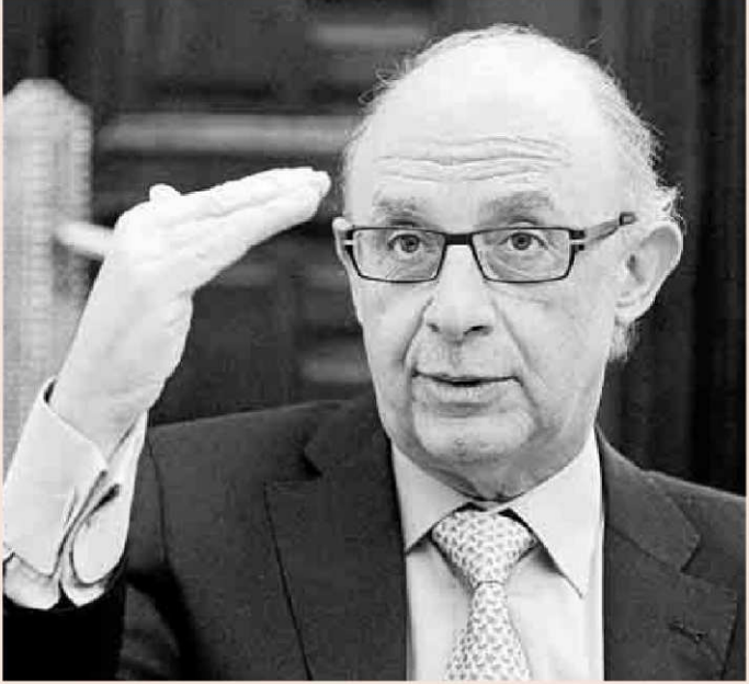
El ministro de Hacienda y Administraciones Públicas, Cristóbal Montoro.

El Gobierno está al acecho especialmente de aquellos ciudadanos que tienen deudas con Hacienda desde hace años. El Estado ingresó hasta noviembre 442 millones de euros de sanciones y multas que había impuesto años antes, que se encuadra dentro de la partida "Presupuestos ce-