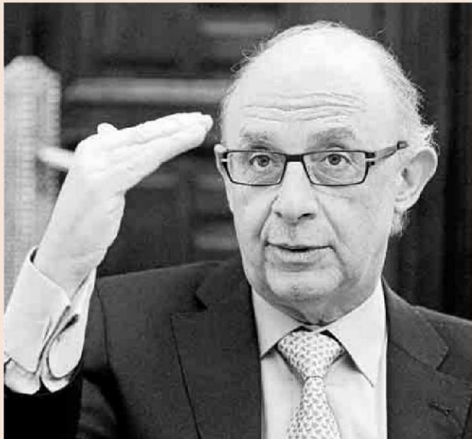
El ministro de Hacienda y Administraciones Públicas, Cristóbal Montoro.

El Gobierno está al acecho especialmente de aquellos ciudadanos que tienen deudas con Hacienda desde hace años. El Estado ingresó hasta noviembre 442 millones de euros de sanciones y multas que había impuesto años antes, que se encuadra dentro de la partida "Presupuestos ce-